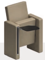
Tavoletta di scrittura ribaltabile a scomparsa Tip-up foldaway writing tablet