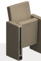
Predisposizione per l'elettificazione (presa elettrica su richiesta) Provision for electric power supply (socket on demand)