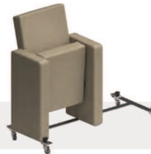
Sistema che permette l'ammovibilità delle poltrone, su ruote, in caso di non utilizzo (per poltrone con piedi da fissare a pavimento in file dritte) Accessory system allowing the armchairs to be moved, on castors, when not in use (for armchairs with floor fixing feet, in straight rows)