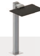
Tavolino di scrittura ribaltabile su base singola mod. T200 Tip-up writing table on single base mod. T200