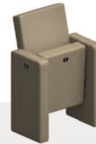
Elemento di identificazione fila e numerazione posto Row identification element and seat numbering