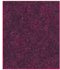
Banbridge Hourglass QZH32 (Black thread) Channel QZC32 (Black thread)