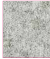
Silverdale Hourglass QZH28 (White thread) Channel QZC28 (White thread)

These fabrics come in two differnt designs - Hourglass and Channel - in 8 colourways.