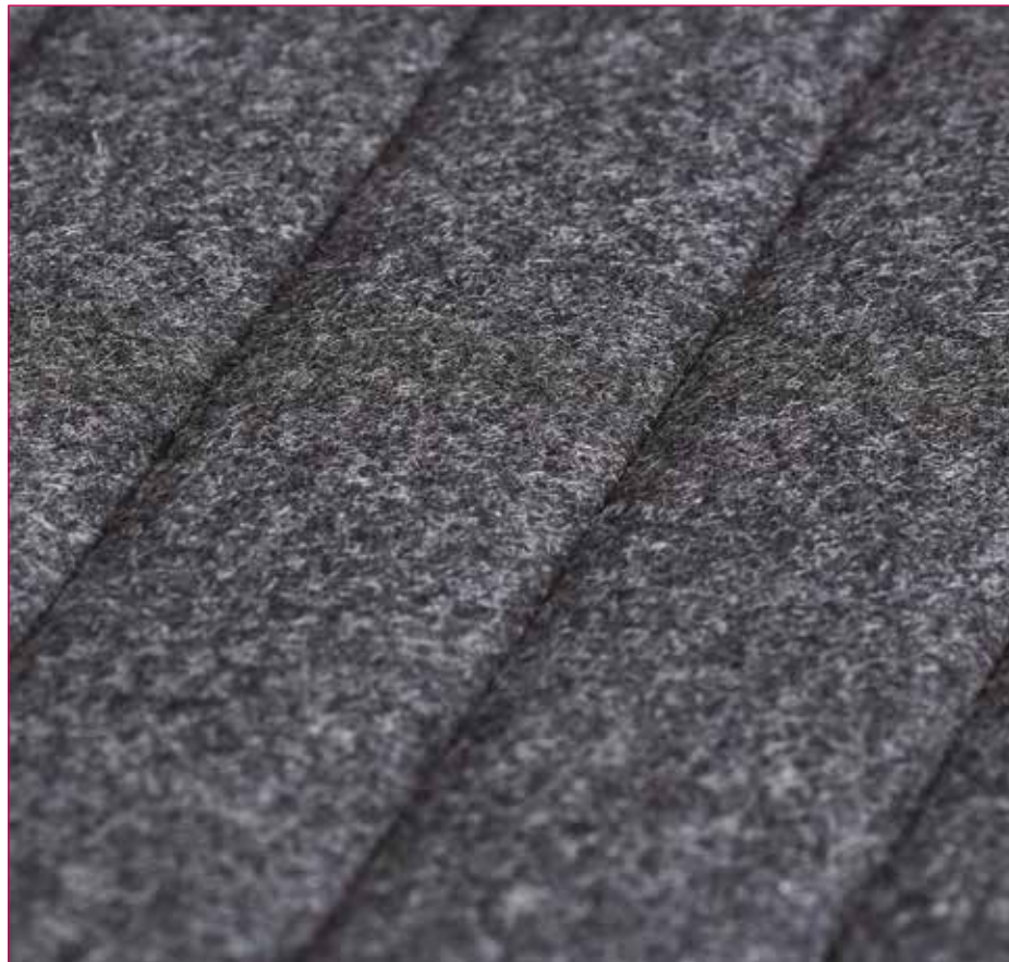
Channel - Silcoates QZC30 (Black thread)