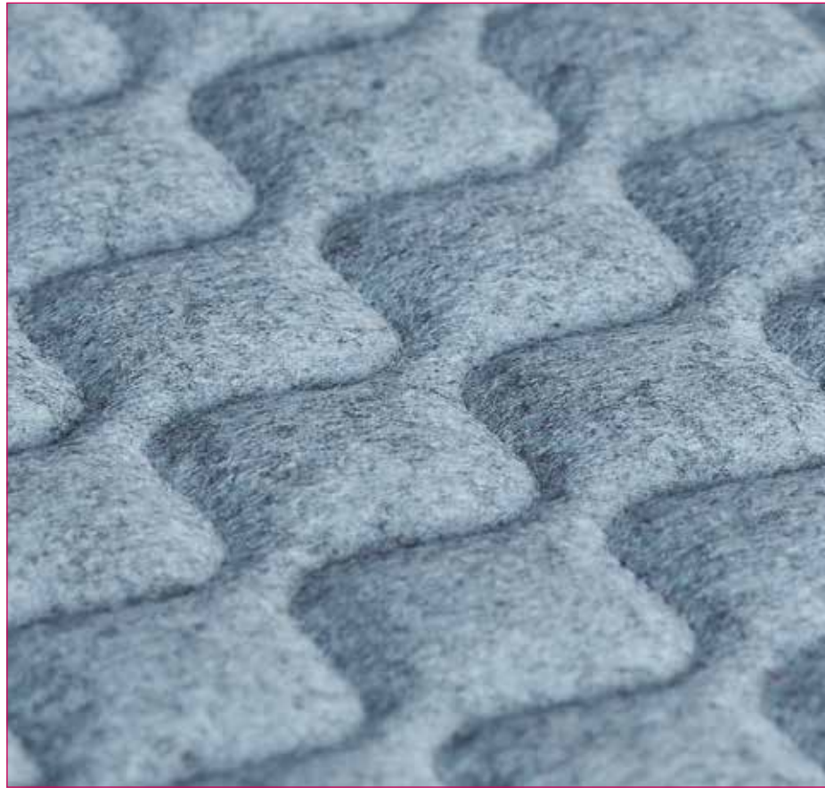
Hourglass - Plymouth QZH1R (White thread)