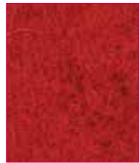
Handcross Hourglass QZH63 (Black thread) Channel QZC63 (Black thread)