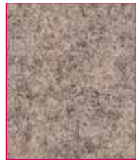
St Andrews Hourglass QZH86 (White thread) Channel QZC86 (White thread)