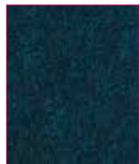
Glenalmond Hourglass QZH62 (Black thread) Channel QZC62 (Black thread)