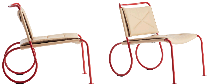
Corso fätölj/Corso easy chair