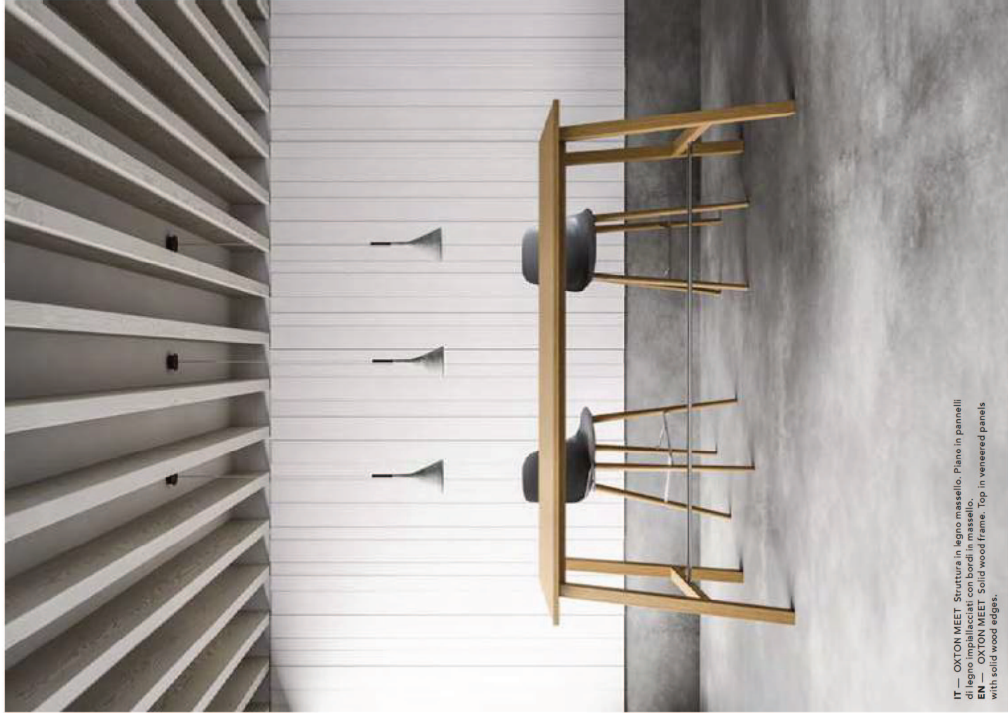
IT — OXTON MEET Struttura in legno massello. Piano in pannelli di legno impiallacciati con bordi in massello. EN — OXTON MEET Solid wood frame. Top in veneered panels with solid wood edges.