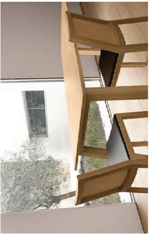
IT — OXTON. Struttura in legno massello. Piano in pannelli di legno impiallacciati con bordi in massello. EN — OXTON. Solid wood frame. Top in veneered panels with solid wood edges.